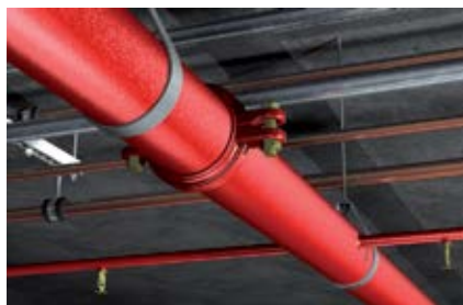
Системы аварийного пожаротушения