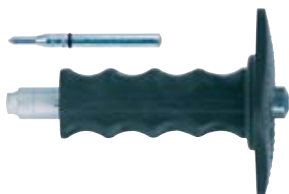
Установочный инструмент FZE plus