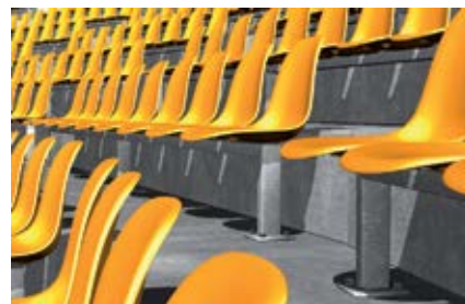
Сиденья на стадионах