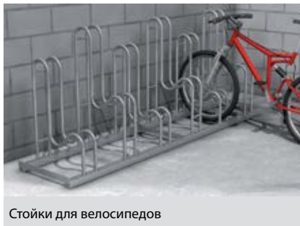
Стойки для велосипедов