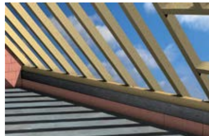
Крепление кровельной обрешетки