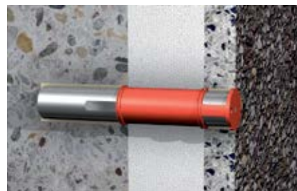
Фрагмент: Восстановление поверхностей, подверженных воздействию атмосферных факторов