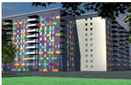
Восстановление поверхностей, подверженных воздействию атмосферных факторов