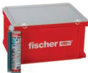
FIS VS 360 S HWK большой