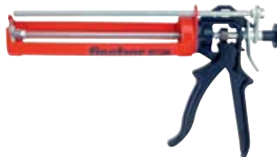
Выпрессовочный пистолет FIS AM