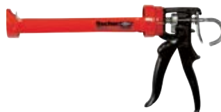
Выпрессовочный пистолет KPM 2