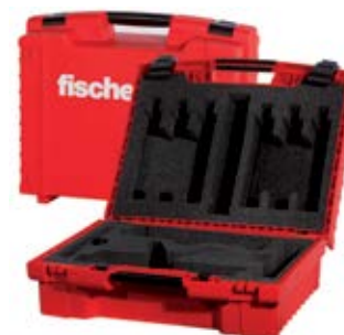
Термозащитный кейс, пустой