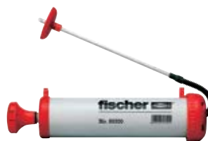
Продувочный насос ABG