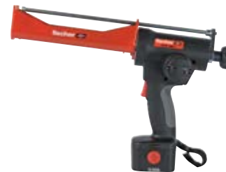
Аккумуляторный выпрессовочный пистолет FIS DC 4000 S