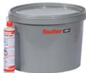
FIS VS 300 T в контейнере