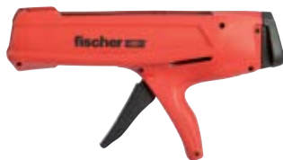
Выпрессовочный пистолет FIS DM S