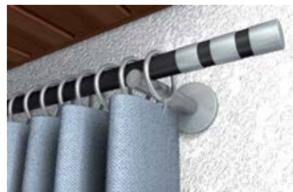
Ремонт кронштейнов для занавесей