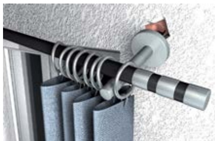
Ремонт кронштейнов для занавесей